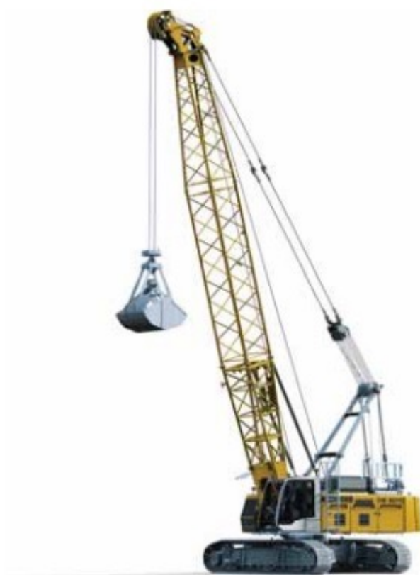
Grajfer – za utovar / istovar materiala