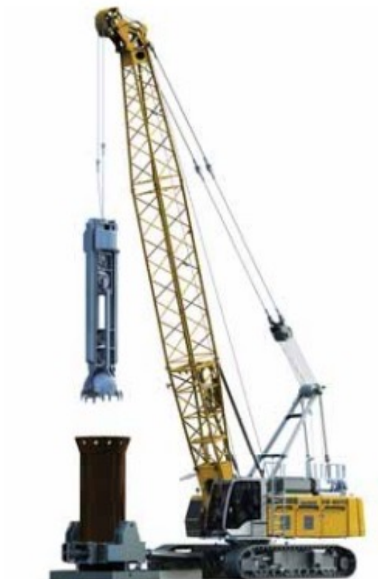
Oscilator kolona Max. prečnik bušenja: 1800 (2000) mm